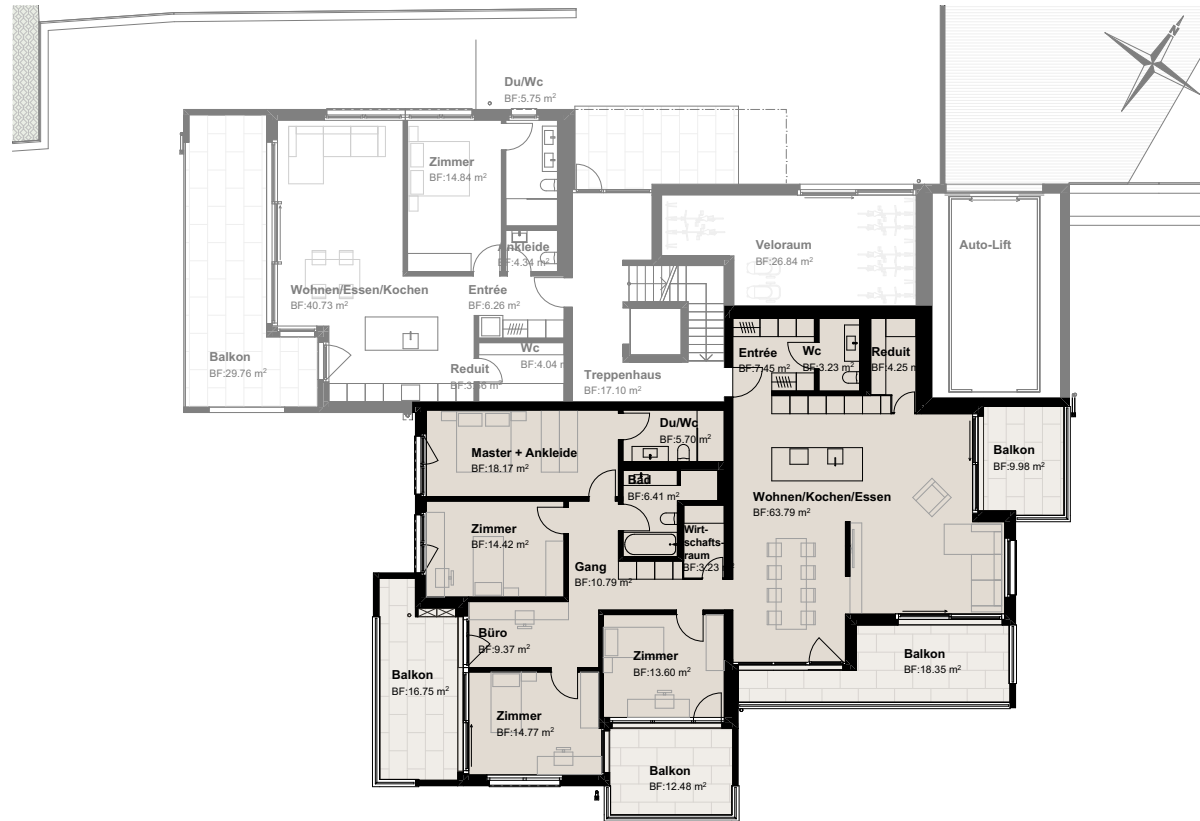
Grundriss 1. Obergeschoss